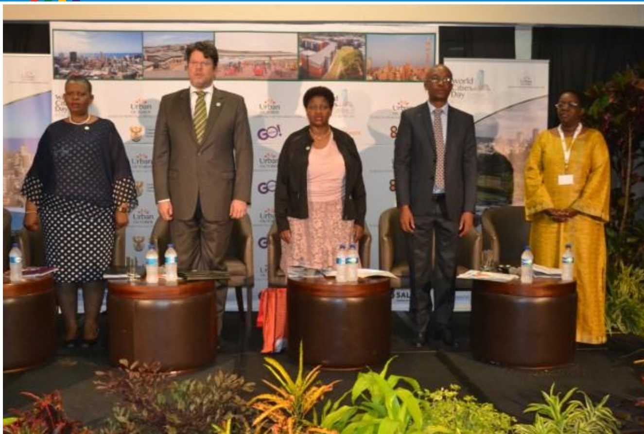
Présidium célébration journée mondiale des villes